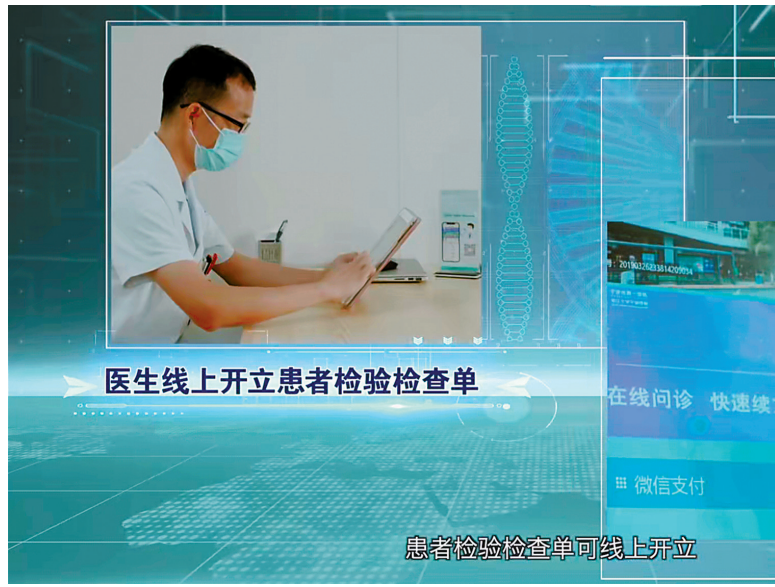
医生线上开立患者检验检查单

记者 陈敏 “创新‘互联网+医疗健康’服务，建成新一代全民健康信息平台，互联网诊疗服务突破200万人次。”