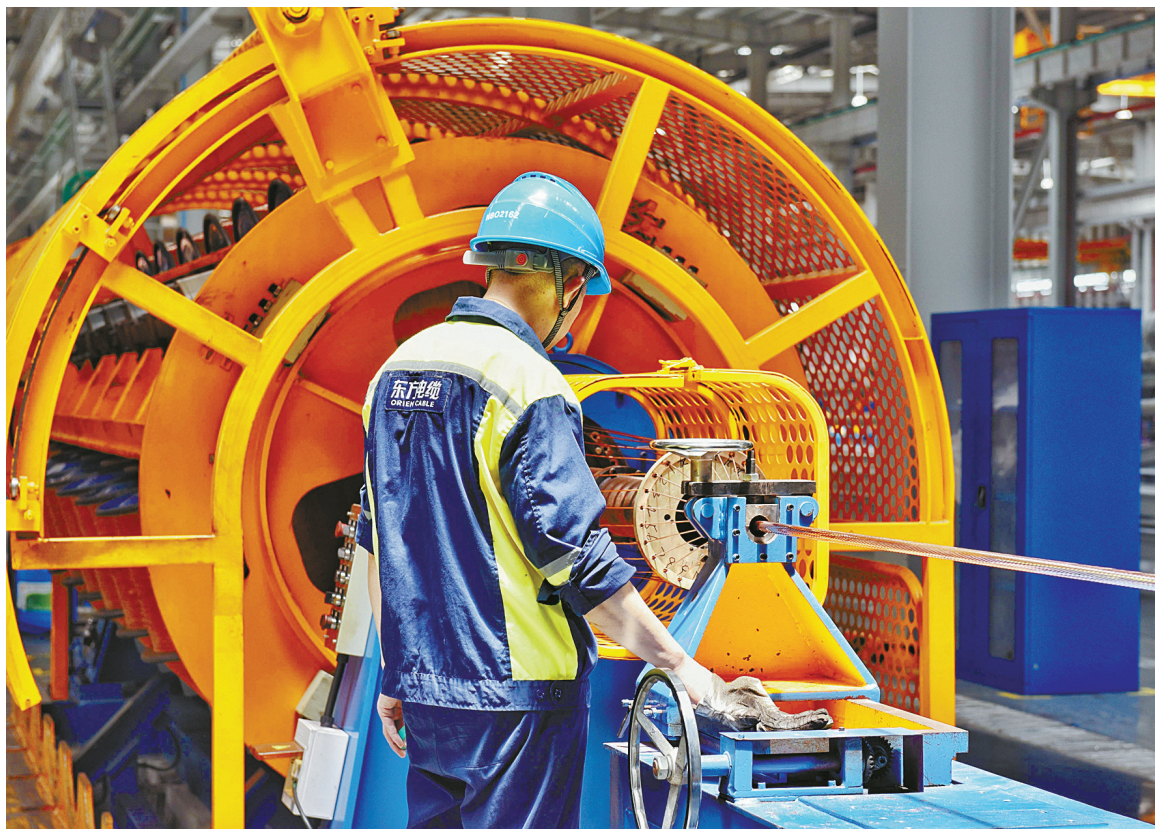
链主企业需要带动产业链上下游企业协同创新。