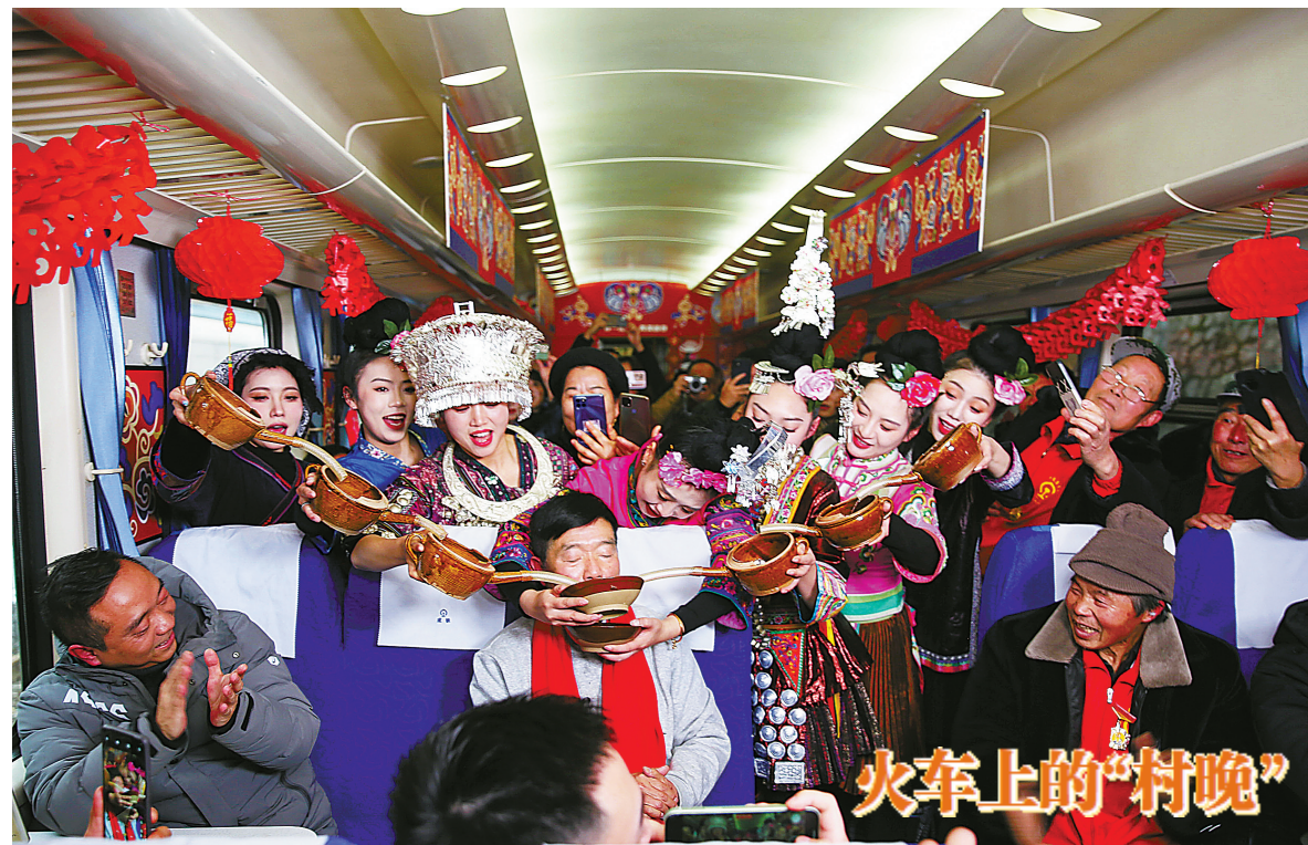
1月26日,在5640次列车上,少数民族演员向老铁路建设者们敬酒。 1月26日,2024年全国“村晚”示范展示活动在沪昆铁路5640次列车上举办。活动以车厢为移动舞台,串联起途经的站点和村寨,向全国观众展现喜庆祥和的苗乡侗寨新画卷。(新华社记者 杨文斌 摄)

同时,公路人员流动量17564万人次,环比增长9.4%,比2023年同期增长16.6%。其中,高速公路及普通国道省非经营性小客车人员出行量14768万人次,环比增长10.2%,比2023年同期增长9.4%;公路营业性客运量2796万人次,环比增长5.2%,比2023年同期增长78.4%。