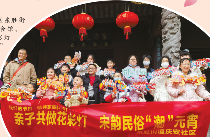
小朋友拿着自己制作的龙形花灯合影。