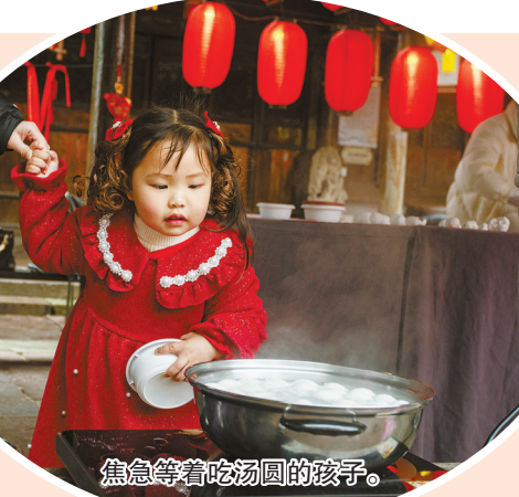
焦急等着吃汤圆的孩子。