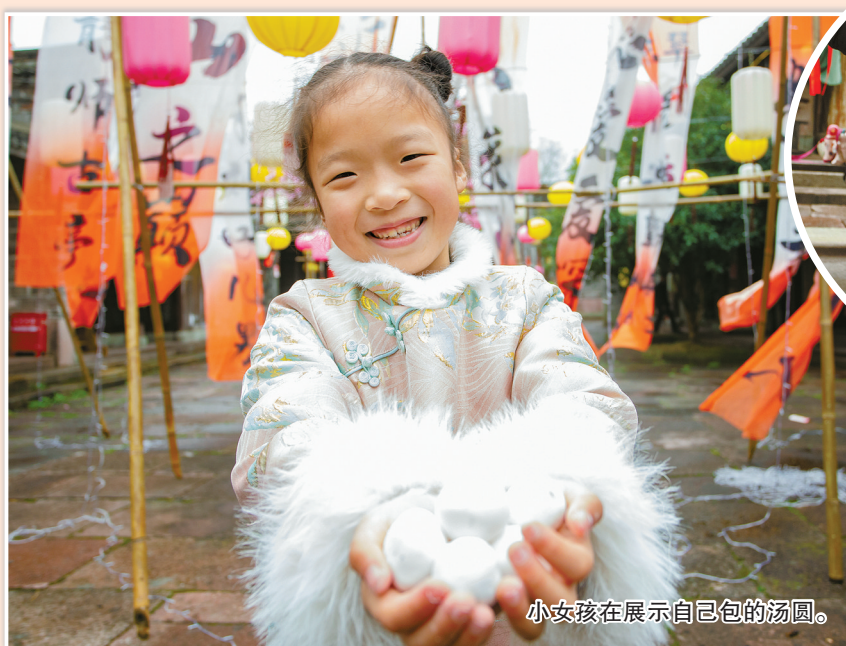
小女孩在展示自己包的汤圆。