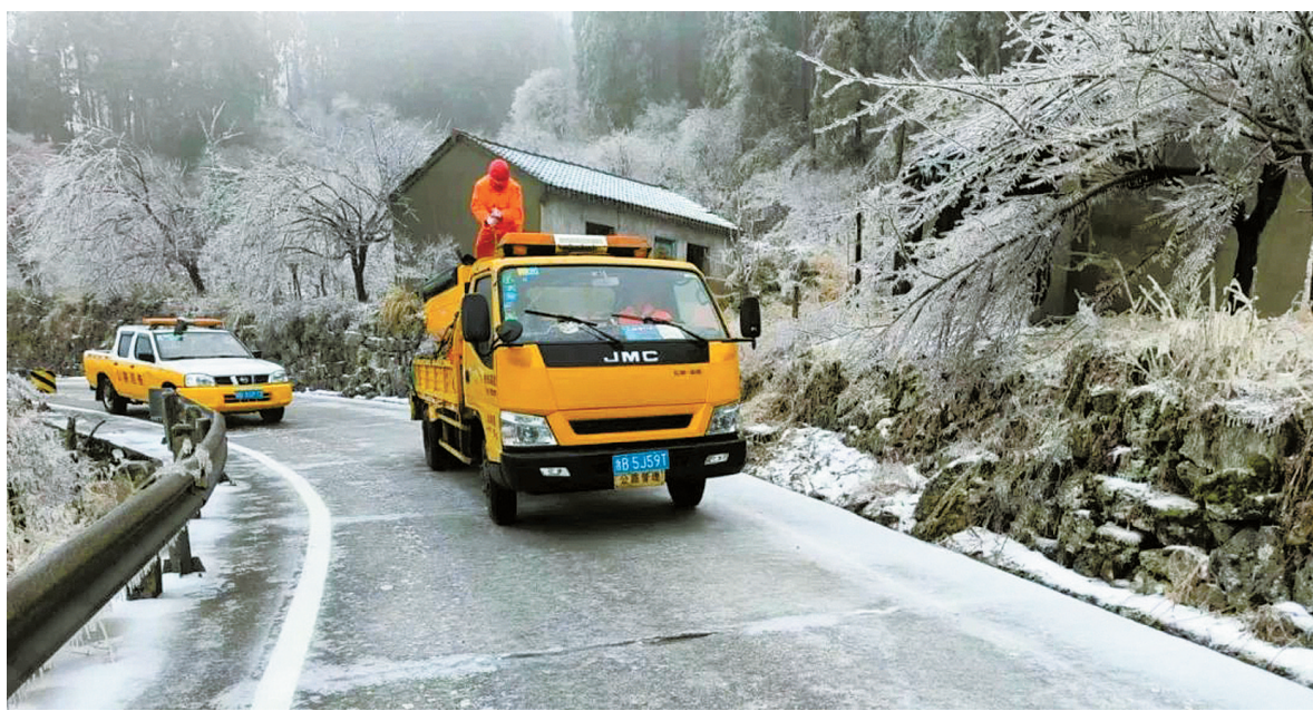
工作人员除雪保畅。

结合降雪情况,工作人员在重点“保畅通”线路,点位增加机械、人员力量,采用“随下随清”的24小时