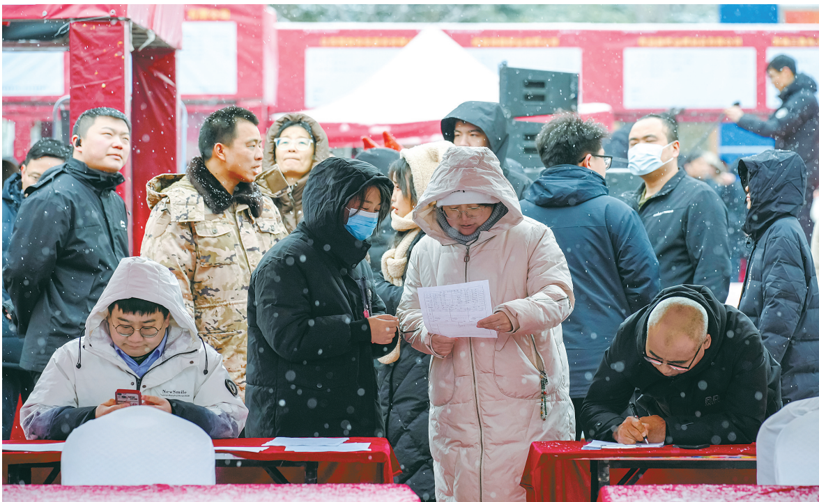
2月21日，求职者在山西省运城市举办的“2024年春风行动”暨高校毕业生招聘、“点对点”劳务输出系列活动现场寻找适合的岗位。

“劳动者盼着早返岗、早增收，节后外出务工步伐加快，大年初二就开始陆续返城。”人社部就业促进司副司长运东来说。