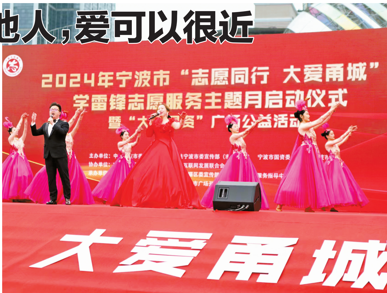
2024年宁波市“志愿同行 大爱甬城”学雷锋志愿服务主题月启动仪式现场。

生活在这座城市的人们，总在不经意间带给我们感动——是纵身跃入冰冷江水救人的老教师，是给素不相识的患者带来重生希望的男护士，是发挥余热护送孩子放学的“共享奶奶”……这一束束“凡人微光”，迸发出闪耀的能量，既照亮别人的路，也引来更多光的汇聚，形成更为强大的精神力量。