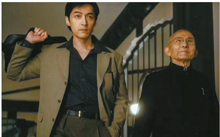
《繁花》中的爷叔（右）集高人与贵人于一身。

高人，通常指的是那些才华横溢、智慧超群、品德高尚的人。他们不仅在自己的专业领域里有非凡的成就，还会对他人与社会产生深远的影响。他们像一座巍峨的山峰，让人仰望。人生路上，得遇高人指点，实在是幸运之极。