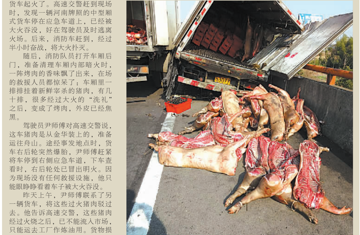
图为部分过火后的猪肉，正准备转卖。

本报讯（记者沈孙晖 通讯员俞晓勤）刚刚过去的“1314”跨年夜，对于很多情侣来说颇有纪念意义，因为有一“生一世”的美好寓意。但对刚失恋的小王来说却是不堪回首：那个跨年夜他连番上演了“荒唐剧”。1月1日上午9时许，鄞州高桥派出所接到女子王某报警，称一名醉酒小伙浑身湿透，闯入她的家中强行换衣。民警随即赶到，将小伙带回派出所。直到当天下午1时多，小伙才清醒。据了解，小伙姓王，23岁，河南人，在高桥镇藕缆桥村摆摊。1月1日凌晨3时多，他摆完摊来到藕缆桥某KTV门口吃夜宵。由于刚失恋，又是独自跨年夜，王某心绪不宁，就点了数瓶二锅头，共计一公斤，一直喝到天亮。