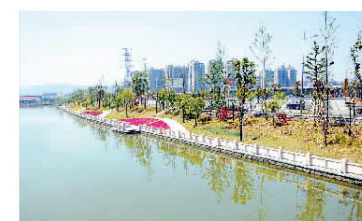
图为姚江干流防洪整治工程整治一新的竹山江段。

此外,余姚还将进一步加快农田水利建设,今年计划投入2.26亿元启动12个项目。包括中央财政小型农田水利重点县(第四批建设项目)涉及4个乡镇街道,将新建改造泵站67座,新建沟渠近30公里;宁波市级小型农田水利示范