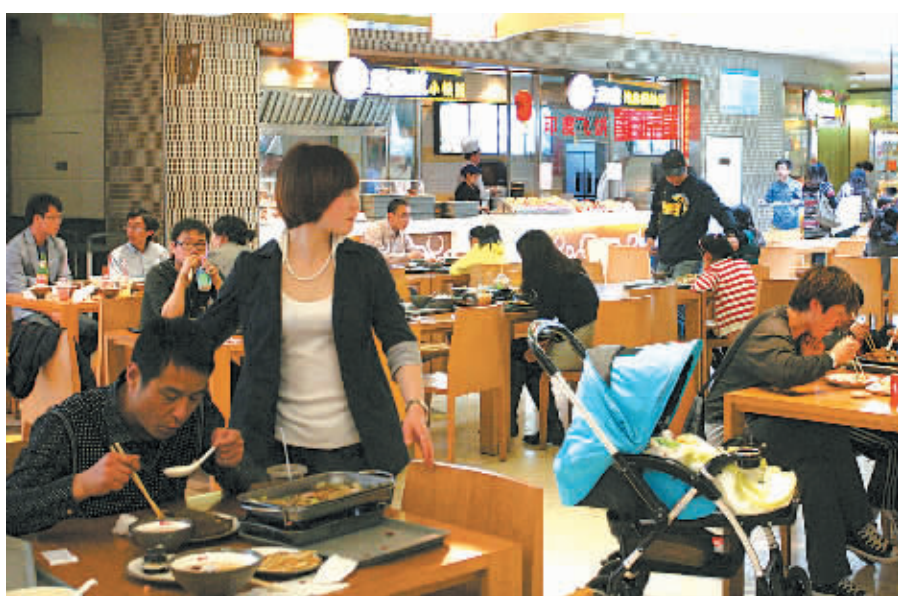
餐饮市场整体回暖迹象明显。

“从现在起到除夕，我们基本是三天一场企业年会。”和丰花园酒店负责人告诉记者，由于价格标准较去年同期大幅下降，加上酒店为吸引客户对场地、服务水平也做了提升，不少企业又“回归”选择在酒店里举办年会、聚餐。“往年，一般档次的企业年会一桌价格平均2500