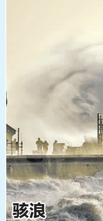
骇浪 1月6日,在英国南威尔士的波斯考尔港,巨大的海浪拍打在堤岸上。