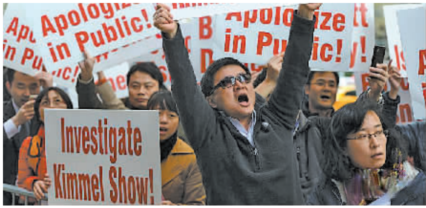
2013年11月8日,华人华侨在美国广播公司门前进行示威抗议。

新华社供本报特稿 美国白宫10日对抗议美国广播公司“吉米·基梅尔脱口秀”节目辱华言论的民众请愿作出回应,称那些言论不反映美国社会对中国的主流看法,但白宫不能要求美国广播公司停播这档节目。