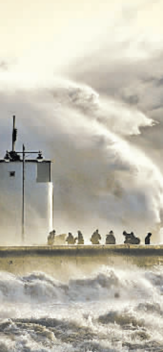
喷发 1月11日,印尼锡纳朋火山持续喷发。