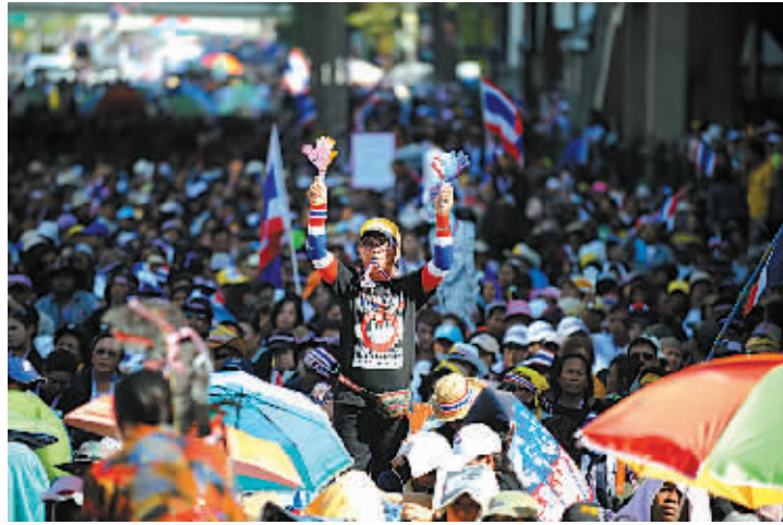
1月13日,泰国反对派的支持者在曼谷商业中心的“世贸百货”商场附近参加集会。

新华社供本报特稿 泰国反对派“人民民主改革委员会”13日启动筹备多日的“封城”行动,锁定首都曼谷的8处建筑和7处路口为主要目标,试图以街头政治的方式推翻政府。