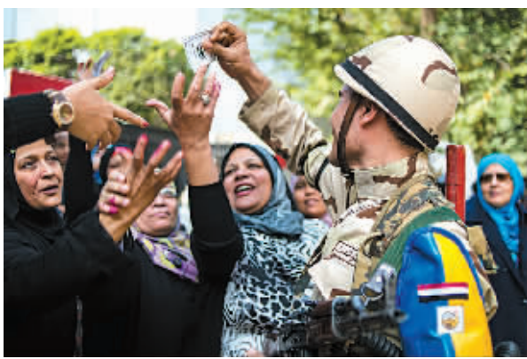
1月14日，在埃及首都开罗，一名士兵在一处投票站外向军方支持者发放“感谢票”。

新华社开罗1月14日电(记者王蕾 田晓航)埃及新宪法草案公投14日早9时(北京时间15时)开始在全国27个省份3万余个投票站举行，公投将持续两天。