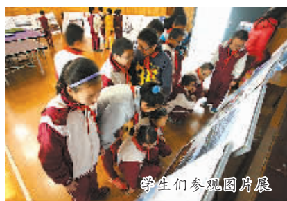
学生们参观图展展

2013年12月25日下午，由江东区文广新闻出版局和江东区教育局共同主办的“讲海商故事，做创新少年”中小学生学习故事演讲比赛在江东区青少年宫举行。通过全区各中小学层层筛选，25名优胜选手代表街道和学校参加决赛，参赛者以《海商印迹》与《江东记忆》为蓝本，讲述对海商文化和精神的理解，抒发真情实感，精彩的演讲中流露出对家乡的热爱之情。