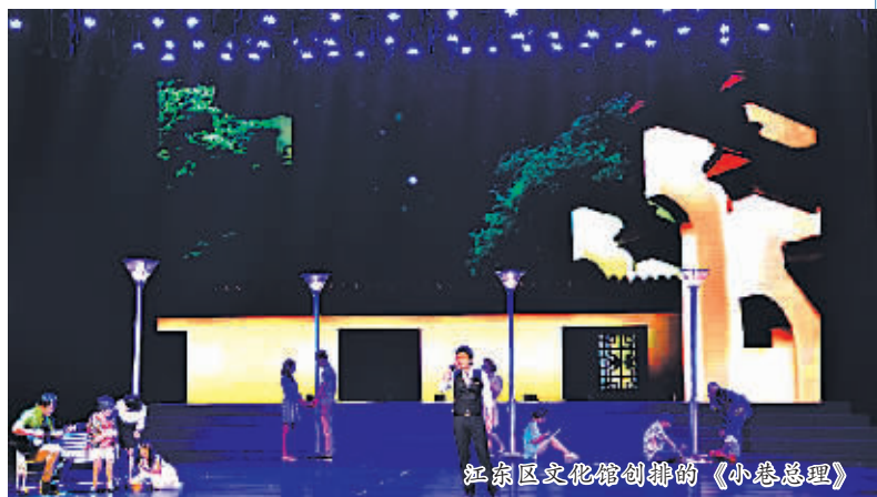
江东区文化馆编排的《小巷总理》

这些优秀文艺团队成为江东各类群众文化活动的生力军，不仅提升了文化惠民团队的核心竞争力与公益服务软实力，而且发挥着文艺领头雁的引领作用，它们将“精品艺术”有效地融入