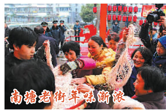
南塘老街年味渐浓

“微运价”的最大特色是“随时随地查运价”。物流供应商用手机扫一扫二维码或者查询微信公众号“W-Freight”关注后,就可以查询整箱运价、热门港口等信息。查询结束后,海运费、人民币费用、船期、航程等基本信息可在明细列表里显示。“微运价”里还有拖卡运价查询,选择目的地直接查询就可以发现目的地和宁波港的路程及车辆行驶的时间。(张正伟 张绘霖)