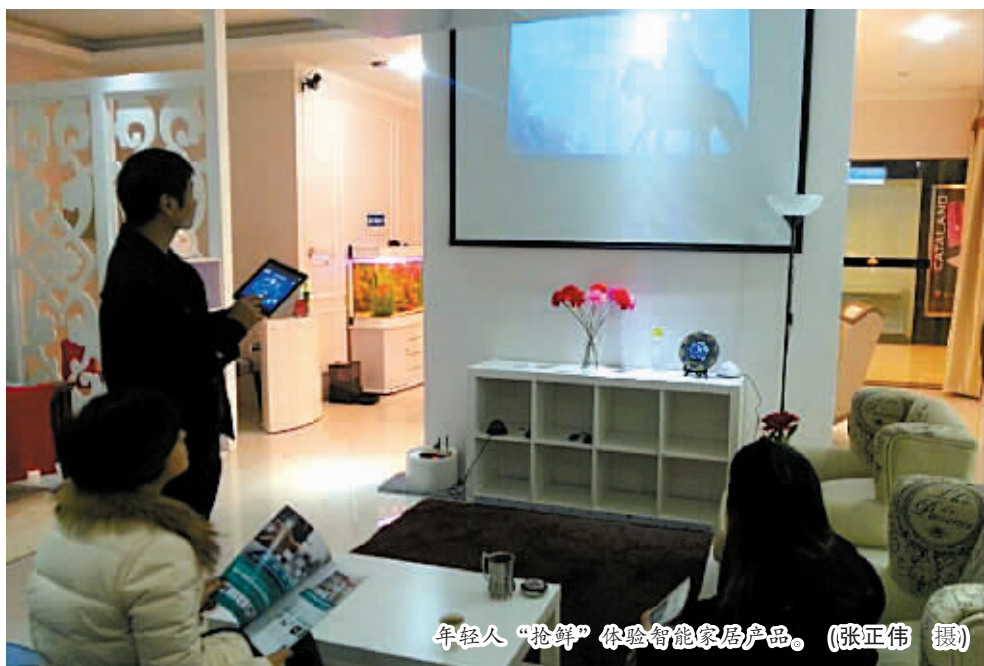
年轻人“抢鲜”体验智能家居产品。