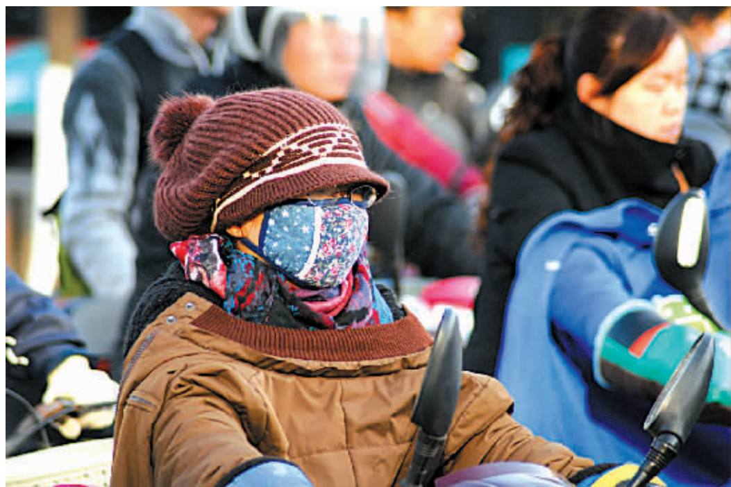
早上上班路上,市民们把自己裹得严严实实。

【上接第1版】李强指出,2014年工作的总体要求是,认真贯彻落实党的十八大及十八届二、三中全会精神和中央有关会议精神,深入实施“八八战略”,以改革统领全局,坚持稳中求进、改中求活、转中求好,“五水共治”、“五措并举”,着力在提质增效上见成效,在改善民生上出实招,在狠抓落实上下功夫,实现全面深化改革的良好开局,推动经济持续健康发展与社会和谐稳定,全面完成“十二五”规划,干好“一三五”、实现“四翻番”奠定坚实基础。