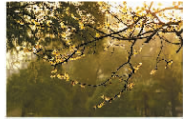
@篱笆园主人: 月湖腊梅香。