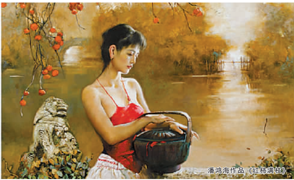
潘鸿海作品《红柿满枝》

本报讯(记者陈朝霞 通讯员徐子现)今天,“江南·写实——油画名家邀请展”在宁波美术馆开展,在8位中国油画“第一方阵”艺术家——马宏道、王庆裕、毛文佐、陈继武、徐芒耀、盛二龙、韩培生、潘鸿海带来的70幅油画作品中,一个充满诗情画意的唯美江南呈现在观众面前。