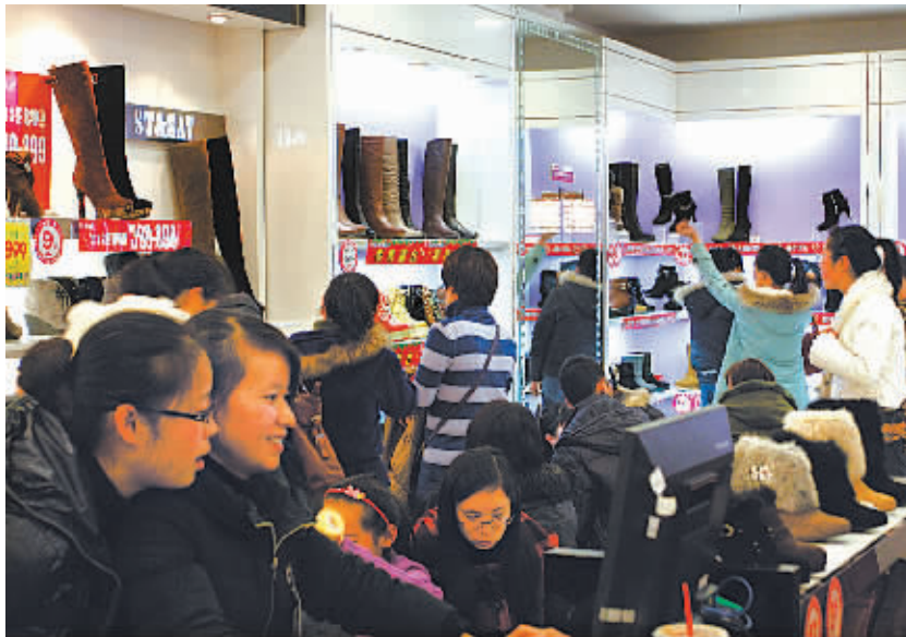
2013年我市社会消费品零售总额预计同比增长13%,顺利实现全年目标。

闲等新兴消费业态正在兴起,市民对这些消费形式也是充满期待,不知市贸易局今年将如何促进新兴消费?