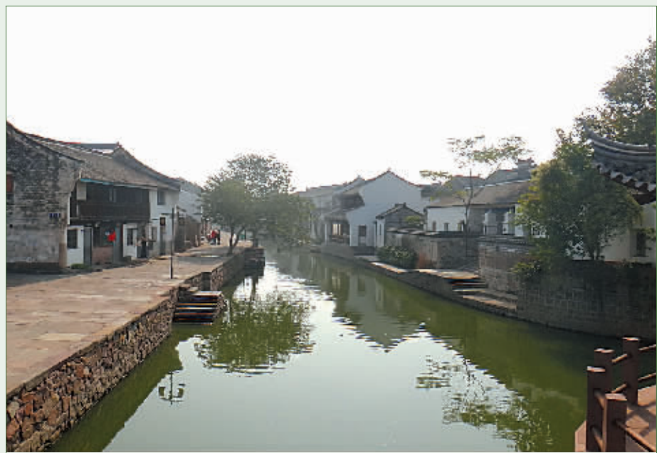
整治后的村庄面貌一新