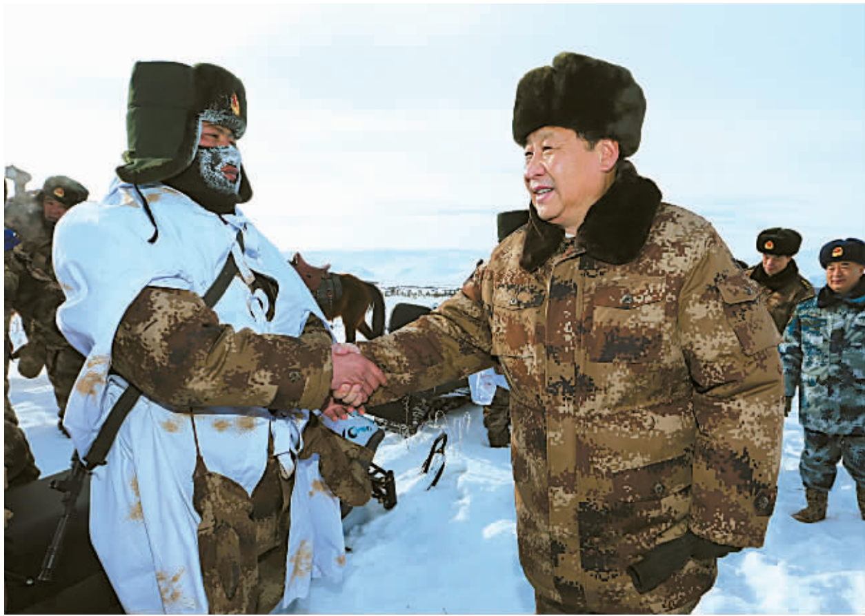
1月26日上午，习近平来到祖国边疆的内蒙古阿拉善盟，冒着零下30多摄氏度的严寒，迎风踏雪慰问在边防线上巡逻执勤的官兵。习近平称赞说，你们战风雪、斗严寒，穿行林海雪原，巡逻在边防线上，我很受感动。大家辛苦了，祖国和人民感谢你们。

新华社呼和浩特1月28日电 春晖万里沐边关，深情厚爱暖兵心。马年春节来临之际，中共中央总书记、国家主席、中央军委主席习近平26日专程来到内蒙古军区边防某部，走巡逻线路，登观察哨所，进连队班排，亲切看望慰问边防官兵，代表党中央、国务院、中央军委，向在祖国边防坚守战斗岗位的全体指战员致以诚挚问候，向解放军和武警官兵、民兵预备役人员致以新春祝福。 隆冬的北国边疆，大地鹤雪，高天寒流。习近平一直牵挂着戍边将士的冷暖。26日清晨，习近平从北京乘飞机直飞1000多公里外的内蒙古阿拉善盟。10时许，习近平一下飞机，就冒着零下30多摄氏度的严寒，迎风踏雪驱车赶往边防连。车行在茫茫雪原，冰封路滑。抵达阿拉善盟口岸，习近平提出要走一走边防巡逻路，看一看一线执勤官兵。 车沿着边防某团一连的巡逻路一路前行，在离国界线2.5公里的地段，远远看到一队官兵驾驶摩托雪橇在冰雪路上巡逻，习近平吩咐就近停车。下车后，他踩着厚厚的积雪向官兵走去。当官兵们看到军委主席来到自己面前，惊喜万分。带队干部立即敬礼，向习主席报告。此时，另一支小分队骑马巡逻经过这里，看到习主席正在同战友们交谈，大家收拢队形，跳下战马，迅速围到习近平身旁。【下转A10版①】