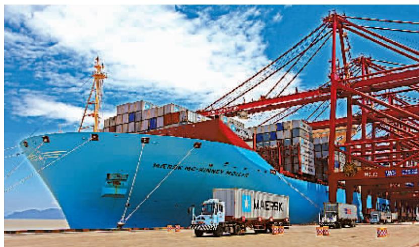
2013年，宁波港货物吞吐量4.96亿吨，比上年增长9.5%；集装箱吞吐量1677.4万标箱，增长7.0%，箱量排名保持大陆港口第三位、世界港口第六。图为全球最大集装箱轮船靠泊宁波港。

完成幼儿园新(改、扩)建88所；农村电影播放30000余场，演出戏剧6000多场次；全市新开工各类保障性安居工程160万平方米、18301套，竣工134万平方米、17427套，新增解决户数14069户……一组组统计数据也见证着民生的持续改善。