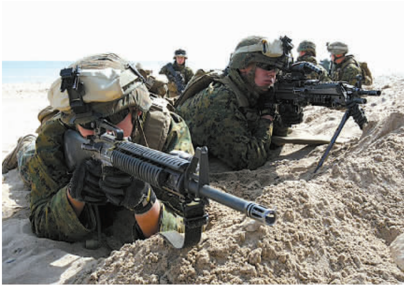
美国海军陆战队士兵在美韩联合登陆演习中瞄准。

新华社供本报特稿 美国在韩国10日宣布，将按计划于本月下旬开始举行两项年度军事演习。 获知这一决定，朝鲜再次拒绝美国特使访问，磋商释放一名美国公民。 韩美坚持军演同时也给久远的朝韩离散亲属团聚计划蒙上阴影。 朝中社的一则简短消息报道，美国前驻韩国大使唐纳德·格雷格作为美国太平洋世纪研究所所长，将率领一个民间机构成员10日抵达朝鲜首都平壤。报道没有提及这一美国团体的使命。