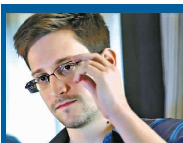
爱德华·斯诺登 (资料照片)

自2013年6月以来，斯诺登通过媒体陆续披露美国国安局的网络和电话监控项目，在美国国内和国际社会引发轩然大波。与此同时，也有一些支持监控项目的国会议员质疑国安局安保工作存在漏洞，才导致斯诺登这类“来自内部的袭击”。今年1月17日，美国总统奥巴马宣布，拟对国家安全局广受争议的秘密情报监控项目作一定程度调整，以期平息国内巨大争议，但他也坚称不会从根本上改变美国情报监控现状。奥巴马1月底已决定提名美国海军网络司令部司令迈克尔·罗杰斯，接替计划今年3月退休的国安局局长基思·亚历山大。