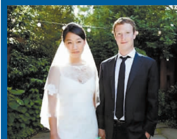
扎克伯格与妻子普丽希拉·陈 (资料照片)