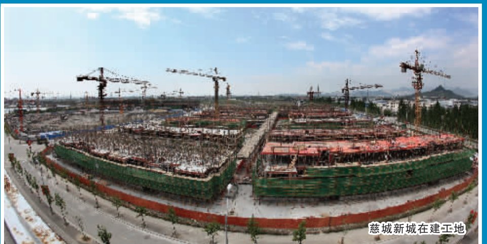
慈城新城在建工地