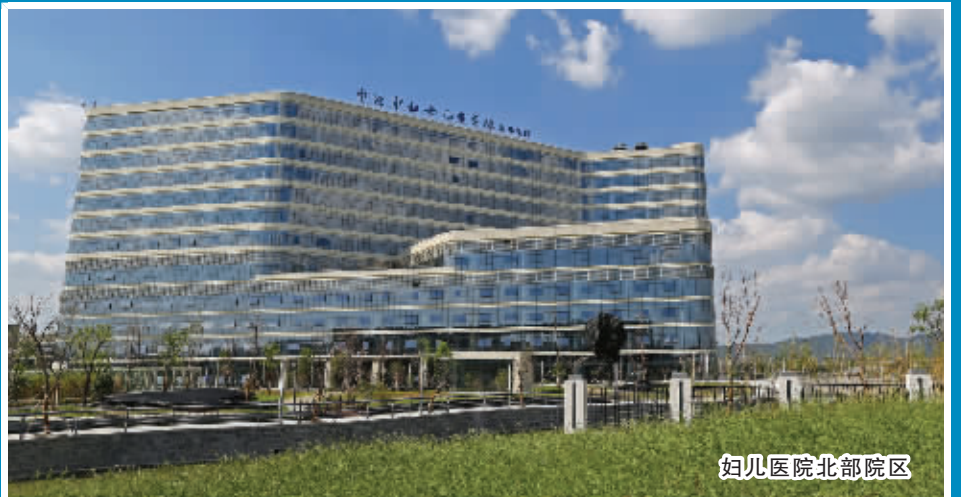
妇幼保健院北部院区