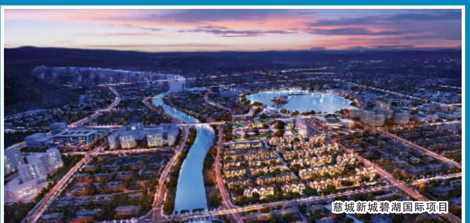
慈城新城碧湖国际项目