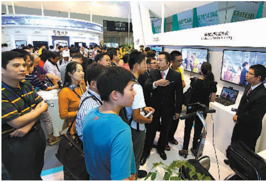
在第三届中国(宁波)智慧城市技术与应用产品博览会上,智慧城市管理展区人流涌动。(智慧办供图)

知环节的一体化部署,我市各大应用体系的建设把感知能力作为智慧应用的基础进行突破。同时继续以医疗、交通、教育等领域为突破口,推进全市范围内重点智慧应用体系建设,同时鼓励各县(市)区开展特色试点。