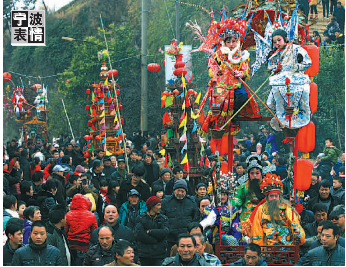
昨天，前童镇浩浩荡荡的元宵巡游活动，吸引了慕名而来的成千上万游客。当天是正月十四，宁海前童镇一年一度的民间元宵巡游集会热闹开场。颇具民俗特色的鼓亭、台阁、秋千等一一亮相，巡游队伍冒着细雨穿街过巷，营造出甬城最浓郁的闹元宵氛围。（周建平 严洁 摄）

如今，赵峰跟老板王荣也比较“有感情”，过年回来都会带点自己家种的土特产。今年，赵峰更是挤着火车，千里迢迢从河南老家给王荣带来了一床用自家种的棉花做的十斤重棉被。赵峰很看重“老板的为人”，“要是老板为人不好，即使多给点钱我也不愿意干。”今年28岁的王建与赵峰有着同样的想法。来自山东的王建，2010年来到王荣的汽修厂，“老板人好，效益好的时候，还会主动给我们加薪，工作氛围很好。去年效益不好，年终奖少了些也是可以理解的。老板经常去新华书店买专业书让大家看，研究技术。”王建今年也从老家给老板带来了自家榨的麻油。记者问：“作为老板，如何才能留住员工？”王荣强调道，“把员工当兄弟来看待，为员工提供舒服的工作环境，在发生矛盾时及时沟通很重要。”王荣希望在新的一年里，能创造更好的效益，为员工谋福利。