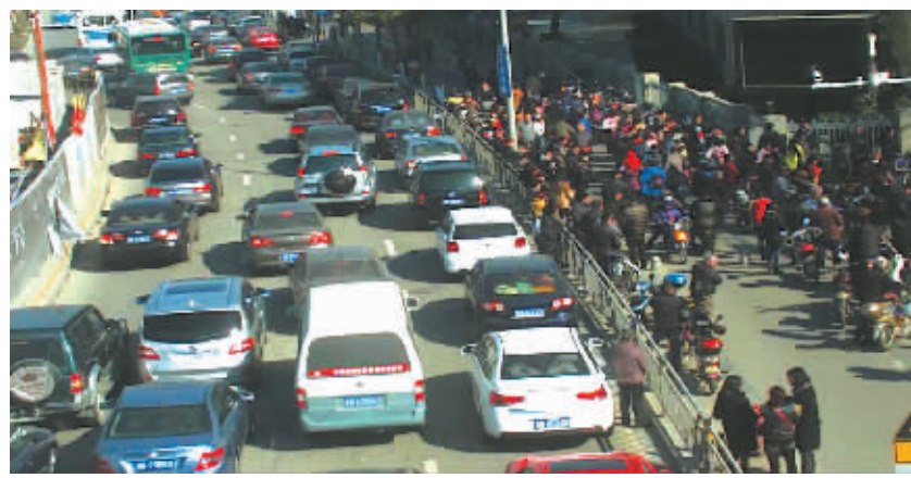
监控年前拍下的江北中心小学接送车拥堵画面。

本报讯(记者王晓峰 通讯员翁恩锋)说起我们身边人为交通“堵点”，除了医院、菜市场等场所外，最让人头疼的就是“每日一堵”的学校门口了。到放学时，接送车辆是围得里三层外三层，排不成排，列不成列，真正水泄不通。