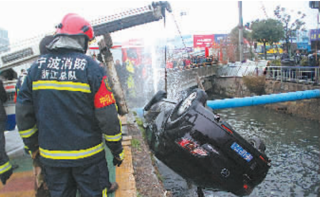
图为救援现场。

本报讯(记者周琼 通讯员孙岑 占智超 刘慧明)近日，慈溪市观海公路和中横线公路交叉口附近，一辆马自达轿车撞断护栏翻入旁边的河中，车上一家三口被困轿中。由于施救及时，车上3人获救，但受伤的男子目前正在接受救治。