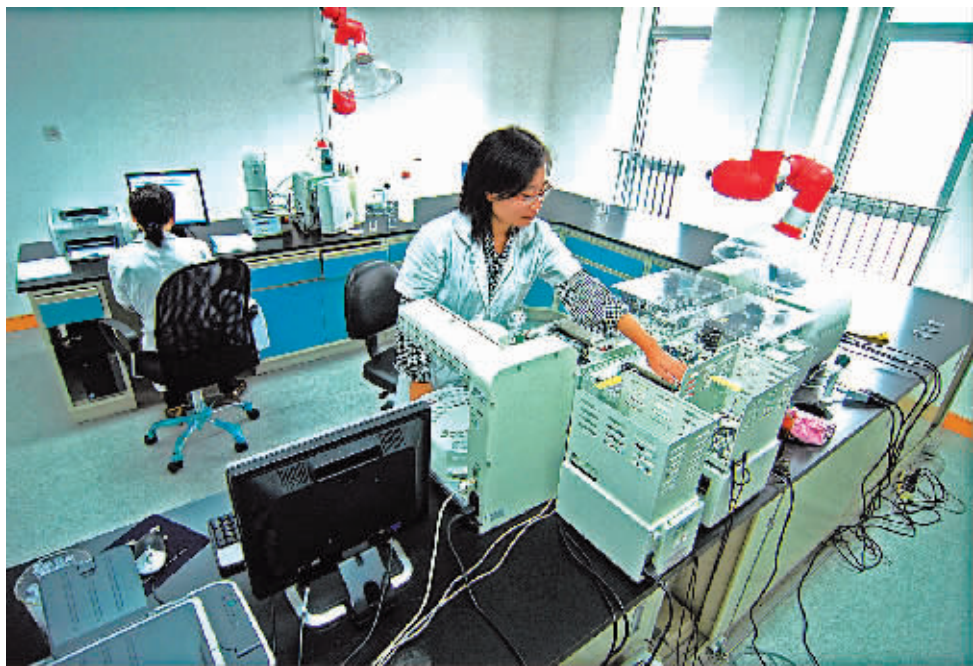
环境监测分析中心实验场景。