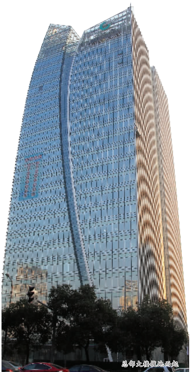
总部大楼拔地而起