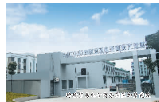
跨境贸易电子商务园区加紧建设

大型电子商务平台企业为龙头，成长型、创新型电子商务企业为主体，物流配送、第三方支付、金融服务、代理运营等配套企业为支撑的“大电商”产业链。同时，依托跨境贸易电子商务产业园区，探索建立跨境电子商务数据交换标准，以标准化的普及和深化来促进口岸数据互联互通，促进跨境贸易便利化及本土、跨境电子商务互促发展。