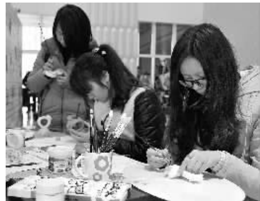
图为创意者在秀作品。