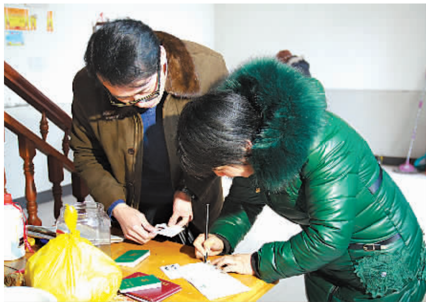
日前,中国人寿宁波分公司工作人员在慈城镇开展理赔服务,向当地投保了农村小额保险的村民家属现金支付赔款2万元。截至目前,江北慈城镇已有7个村参保农村小额保险。

经济社会转型发展三年行动计划,加快发展城乡小额贷款保证保险,拓展“信保融资平台”区域,鼓励发展科技保险等创新险种,为宁波产业升级和技术创新提供保障支持。制定大病保险监管办法,建设大病保险医疗信息平台,确保大病保险试点顺利起步。启动食品安全责任险试点,推动医疗、环境污染、安全生产等责任险扩面升级。