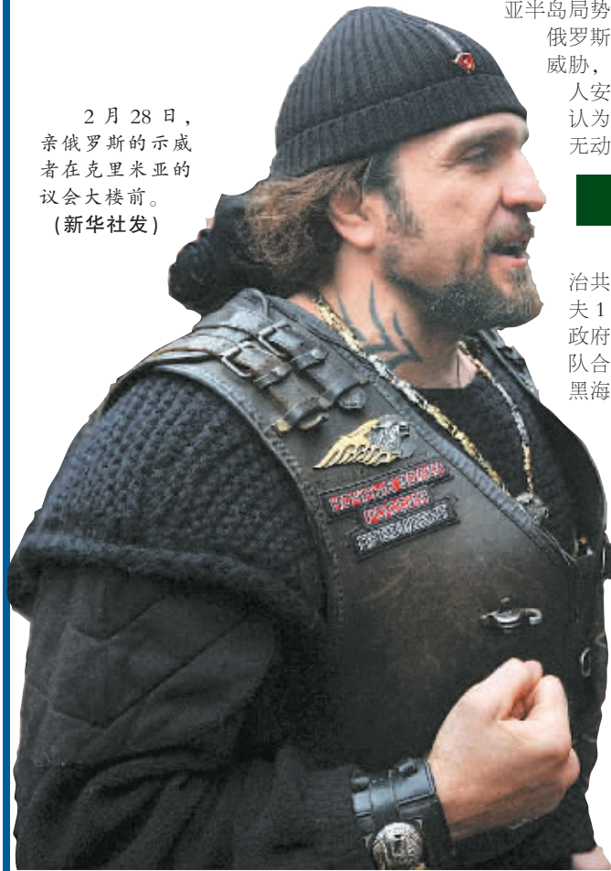
2月28日,亲俄罗斯的示威者在克里米亚的议会大楼前。

武装人员占领,位于塞瓦斯托波尔附近的巴拉克拉瓦的乌克兰海岸警卫队驻地也一度被武装人员包围。图尔奇诺夫28日在基辅紧急召开新闻发布会说,俄罗斯打着演习的幌子已开始对乌克兰进行“露骨的军事入侵”。他说,俄方把军队派入克里米亚,不仅占领克里米亚议会和政府大楼,还试图控制公用设施,封锁克里米亚军人的驻地。他要求俄方立即停止挑衅行为,撤回军队。