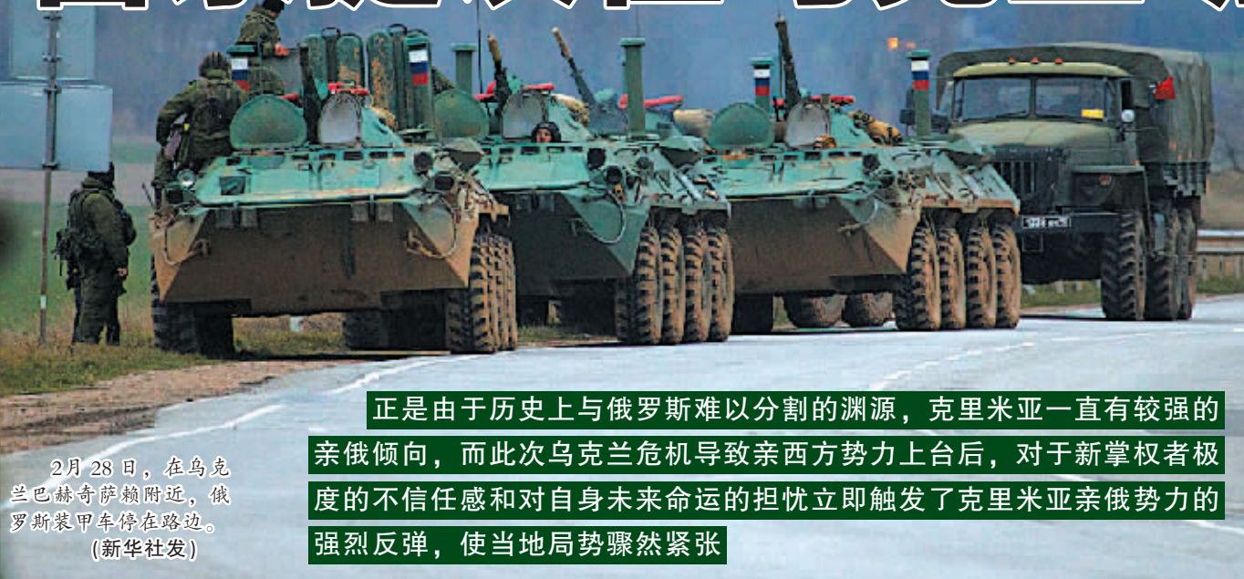
2月28日,在乌克兰巴赫奇萨赖附近,俄罗斯装甲车停在路边。

正是由于历史上与俄罗斯难以分割的渊源,克里米亚一直有较强的亲俄倾向,而此次乌克兰危机导致亲西方势力上台后,对于新掌权者极度的不信任感和对自身未来命运的担忧立即触发了克里米亚亲俄势力的强烈反弹,使当地局势骤然紧张