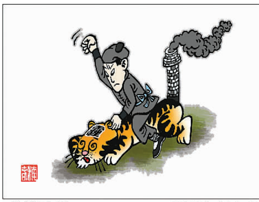
打“霾”虎 新华社发 南海春作

2月21日,环保部有关负责人通报了天津陈塘热电有限公司大面积建筑垃圾裸露、未采取防尘措施问题。而通报三天后,这家公司厂房和南侧道路路边,上万平方米区域内的建筑垃圾仍“素面