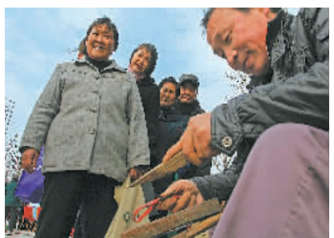
前天,数百名志愿者在日湖公园广场举行各类为民服务活动。

江北区文明办、团区委将根据群众需要,整理出一个志愿服务项目“菜单”,其中包括家电维修、磨剪刀、理发、配钥匙、医疗服务、法律咨询、金融理财、保险咨询、广场义卖等便民服务项目,向全区公布,以供群众“点单”,提供定向服务。