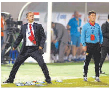
3月5日,佩兰(左)与代理主教练傅博在比赛中观战。

据新华社迪拜3月5日电(记者李震 宋宇)国足5日晚在亚洲杯预选赛最后一轮中客场1:3负于伊拉克队,最终以一个净胜球的微弱劣势力压巴城成为成绩最好的小组第三,惊险晋级2015年澳大利亚亚洲杯决赛圈。新任主帅佩兰赛后认为,队员上下半场表现迥异,但总体而言中国队配得上出线的结果。 佩兰说:“这场比赛应该从两方面来看。一是从预选赛出线的结果看,达到了预期,比较令人满意;但作为球队教练,更应该关注在场上发生了什么。这场比赛我们上下半场表现截然不同。上半场我们的队员比较狂热,令人感到失望。”