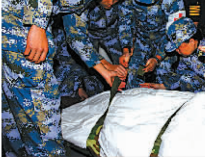
舟山舰官兵转运伤员。

2月8日上午10时30分，舟山舰在舟山一军港码头停靠，岸上医护人员第一时间将受伤渔民转运至海军413医院进行进一步的检查和治疗。目前，伤员情况稳定，精神状态较好，连连表示，感谢中国人民解放军。