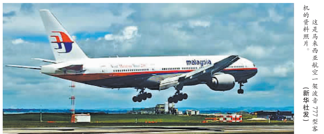
这是马来西亚航空公司一架波音777型客机的资料照片。