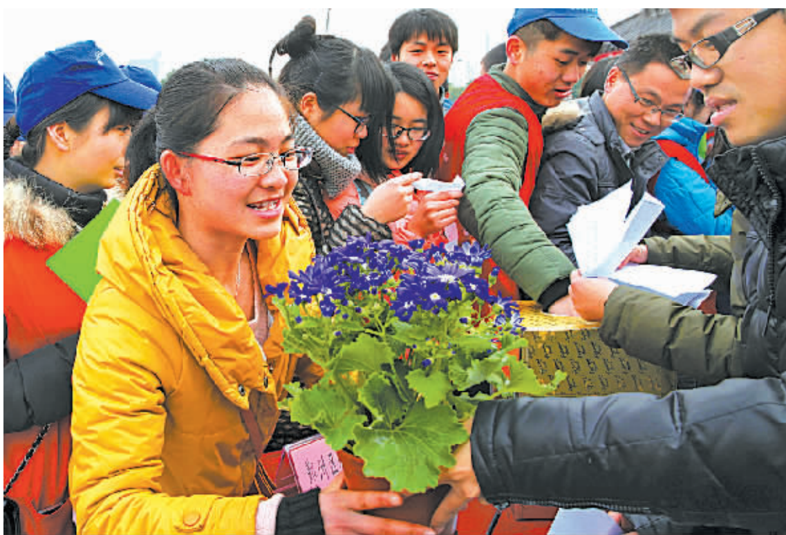
昨天上午,市城管局园林绿化部门在庆安公园举行绿地认养认管签约仪式。图为市民在踊跃认养盆栽植物。

到了社会各界的积极响应,认养认管绿地的数字也在逐年攀升。2004年,我市推出了17块21公顷认养认管绿地。今年,我市推