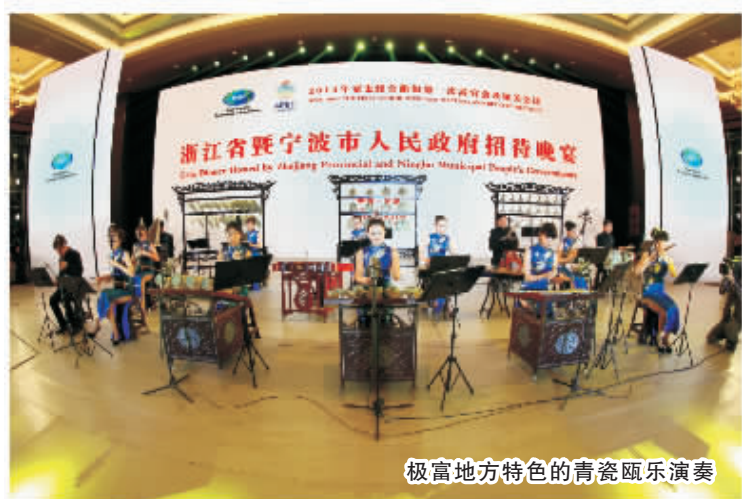
极富地方特色的青瓷乐演奏