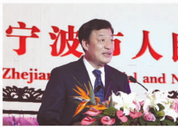
省委常委、市委书记刘奇在省市招待晚宴上致辞

在中央筹备工作委员会的悉心指导、在省委、省政府的高度重视和市委、市政府的直接领导下，经过各相关部门的精心准备和共同努力，我市承担的会议服务保障工作做得周到、安全、细致、有序，得到了中央相关部委和参会代表们的高度肯定和积极评价。外交部副部长李保东对此次会议的服务保障工作非常满意，认为我市思想重视、沟通顺畅、组织有力、服务到位，为会议的顺利举行提供了良好软硬件保障，也为今年在我国其他城市举办的APEC相关会议做了示范。中央筹委会秘书处副秘书长、外交部经济司司长张军在高官会新闻发布会上指出与会的各方代表对宁波在会议服务保障方面所做的工作给予了非常高的评价，宁波高官会为APEC中国全年的活动开了好头，为11月份将在北京举行的第22次领导人会议的成功举行做出了积极贡献。同时，作为今年第一个会议的举办城市，宁波也充分展示了中国在改革开放进程中的精神风貌及开放姿态。APEC秘书处执行主任艾伦·博拉德在答记者问时讲到宁波会务组的工作非常出色，所有会议都进行得非常顺利，我和我的同事都很高兴能够在宁波办会。美国代表团高官王晓岷在代表各经济体高官向宁波致谢时说：“会议期间，我们通过观看景观剧、参观访问、与宁波人的交流，倾听宁波的历史起源、沿革、目睹宁波人的精神与才华，见证宁波城市在发展中变得越来越现代化、国际化，也更加完整、客观地了解了中国。”