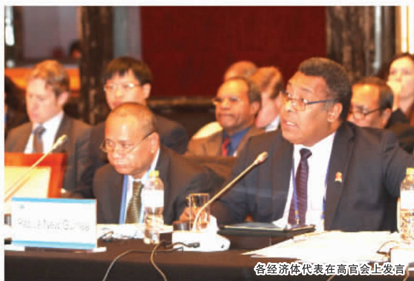
各经济体代表在高官会上发言