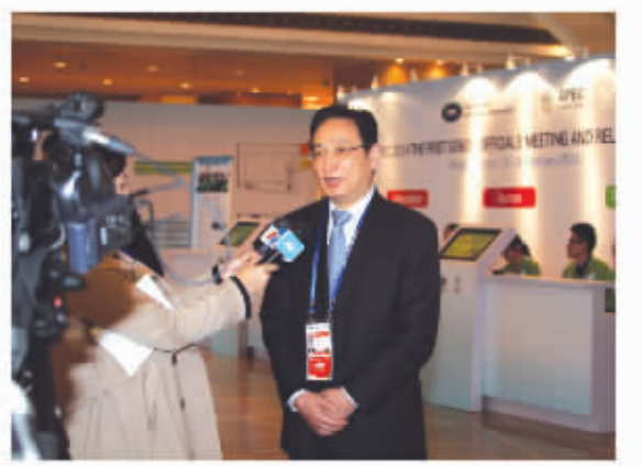
副市长洪嘉祥接受省市媒体采访