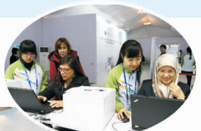
全市400余名志愿者活跃在会议服务保障一线

作为经济合作论坛，APEC主要讨论与全球和区域经济有关的议题，如贸易和投资自由化便利化、区域经济一体化、全球多边贸易体系、经济技术合作和能力建设、经济结构改革等。