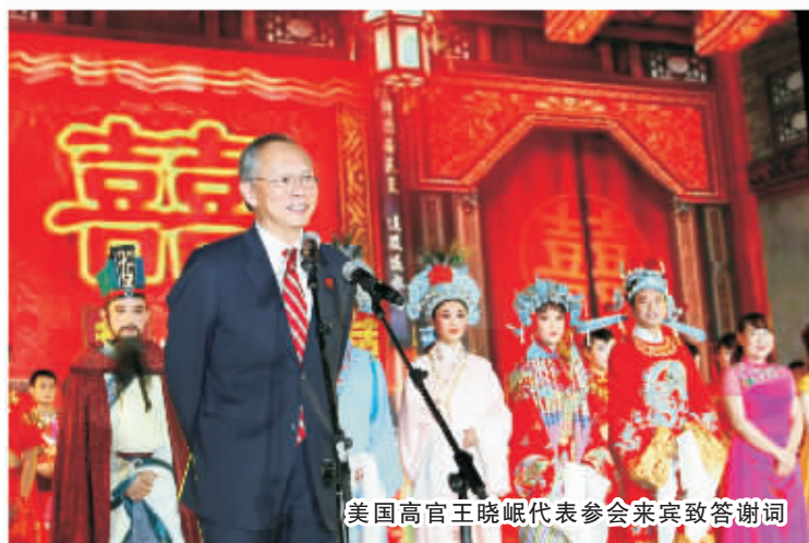
美国高官王晓岷代表参会来宾致答谢词