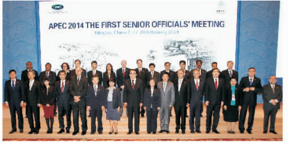
各经济体高官及代表团团长在高官会现场合影

2014年亚太经合组织（APEC）第一次高官会及相关会议于2月15日至28日在我市召开。在历时2周的会期中，共举行大小会议26个、74场，双边会谈会见116场。来自亚太经合组织21个经济体、秘书处、工商咨询理事会，太平洋经济合作理事会，太平洋岛国论坛的1782名正式代表参加会议，其中境外代表1114名。会议期间，浙江省政府和宁波市政府为境内外代表举行了欢迎活动和文艺演出，并安排了内容丰富的参观考察。