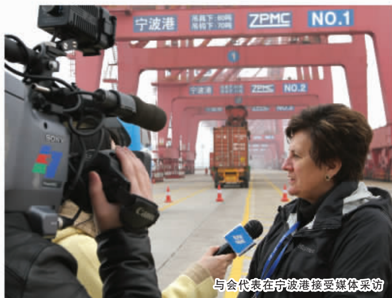
与会代表在宁波港接受媒体采访