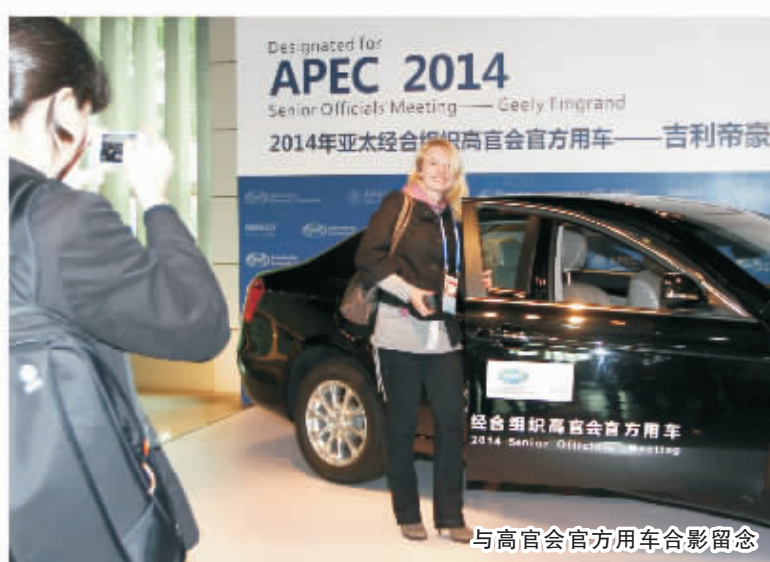
与高官会官方用车合影留念