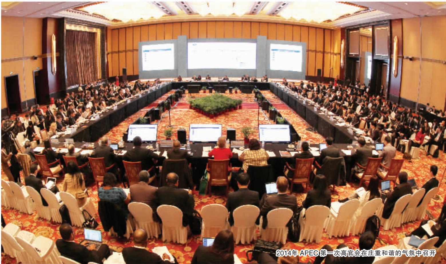
2014年 APEC 第一次高官会在庄重和谐的气氛中召开