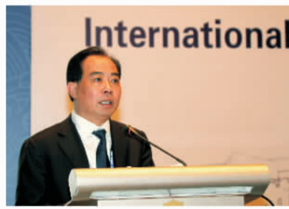
市委副书记、市长卢子跃在 APEC 相关会议上致辞