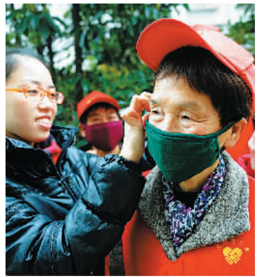
昨天，江东白鹤街道镇安社区工作人员向“一小时义工”发放专用口罩，以减少雾霾天气对健康的影响。