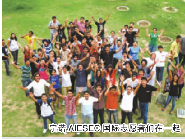
宁诺AIESEC国际志愿者们在一起