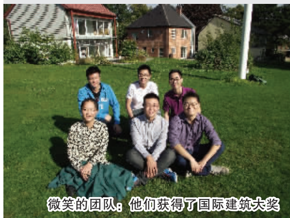
微笑的团队：他们获得了国际建筑大奖