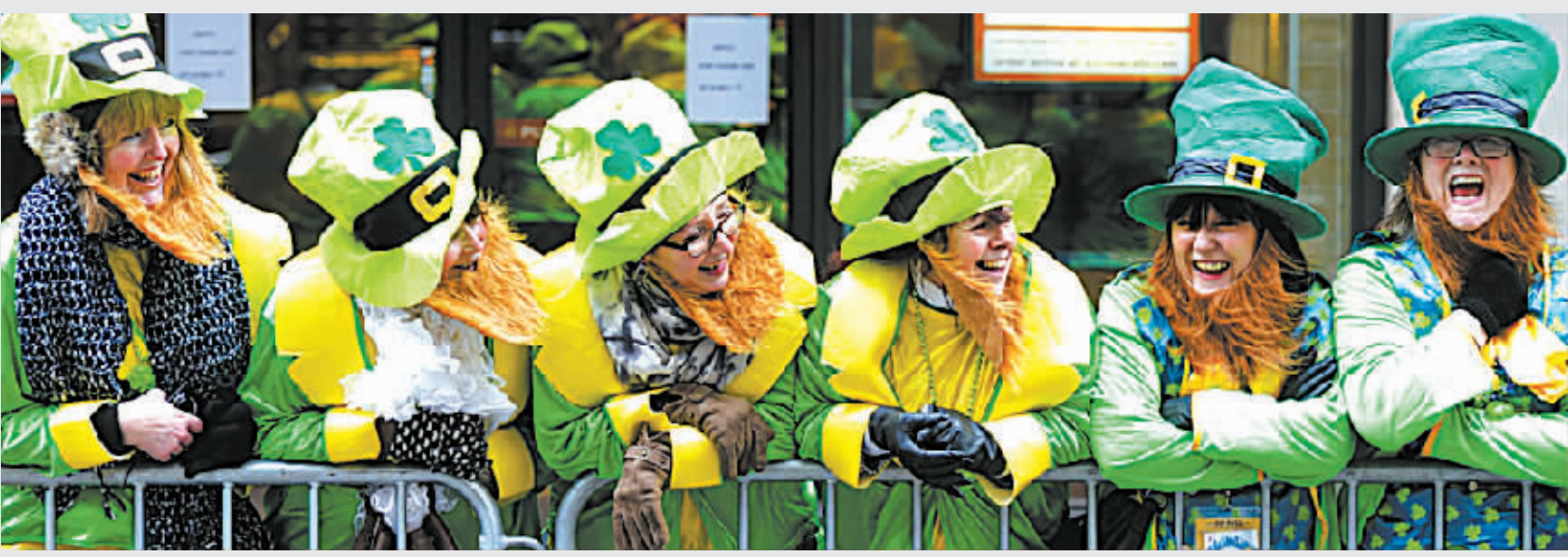
3月17日,人们身着绿色服装在纽约曼哈顿第五大道观看圣帕特里克节游行。