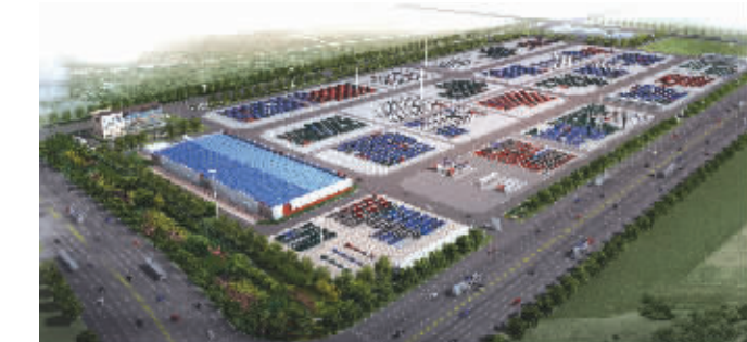
▲梅山汽车物流中心鸟瞰