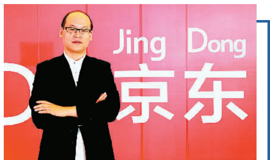
京东商城联席董事长,在京东主要负责组织架构、业务模式、运营流程等方面工作。

本周四,全市电商大会将在文化广场大剧院举行。届时,浙江大学教授陈德人和京东联席董事长赵国庆将亲临现场,为与会者带来精彩的演讲与头脑风暴。一个是学术权威,数学与计算机应用领域的研究专家;一个是业内翘楚,当前国内电子商务产业的领军人物。他们的到来,将为宁波企业家和电商从业者提供从理论到实践的丰富经验。如果你刚入电商门,请到这里来,聆听大师的现身说法,坚定你发展的信心和前行的脚步;如果你已在电商领域小有成就,也请到这里来,分享成功与失败的经验,一起描摹宁波电商的美好明天。