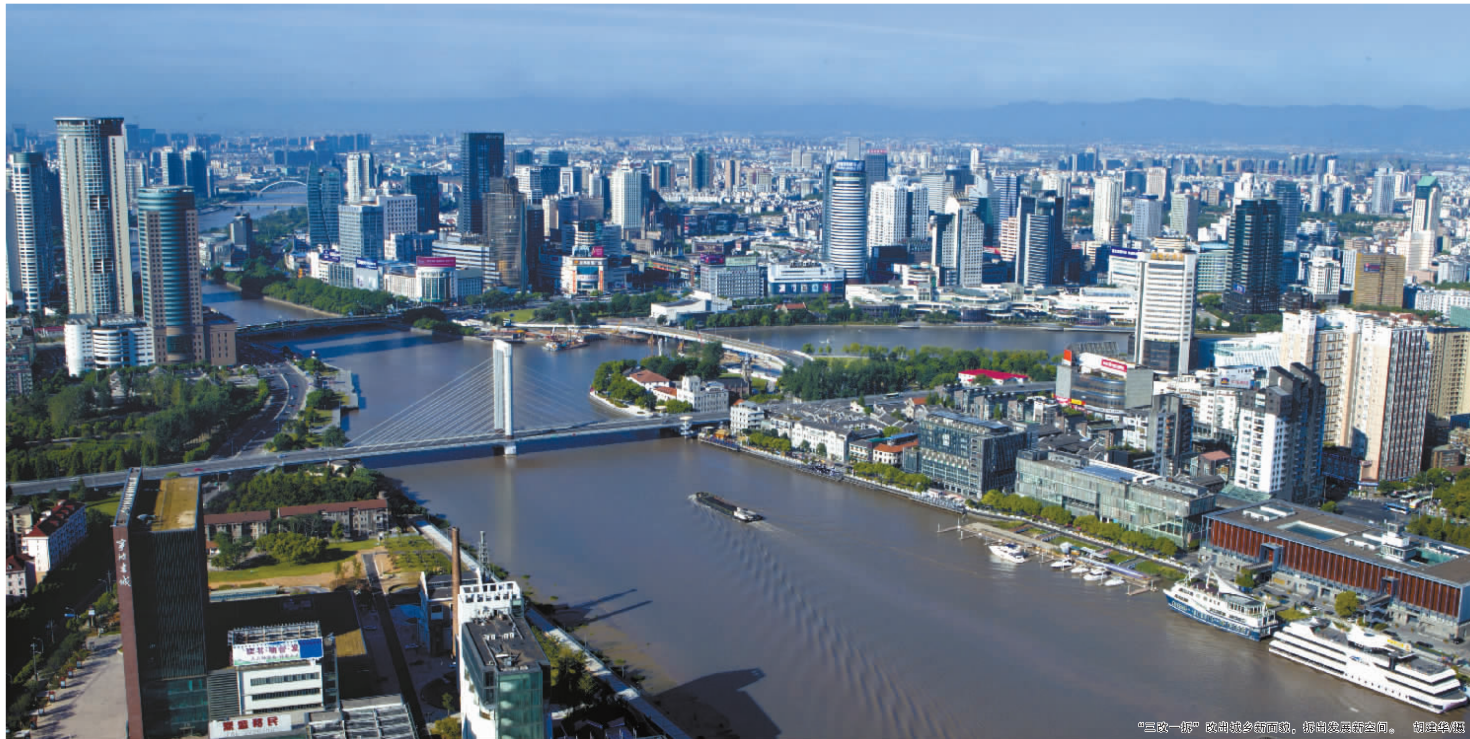
“三改一拆”改造成乡新面貌，助推发展腾空间。