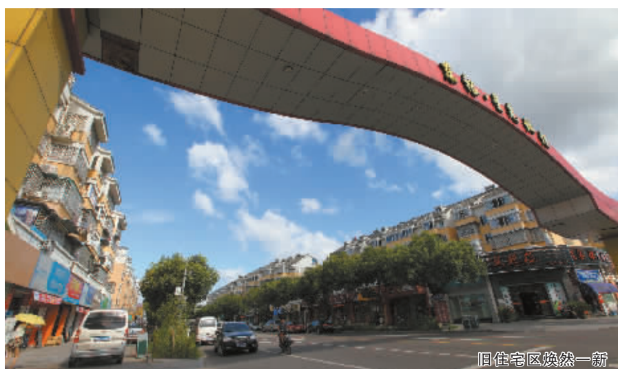
旧住宅区拆除第一

消防安全通道专项整治上，重点整治影响消防车通行和操作、影响人员安全疏散、影响消防水源使用、占用防火间距的违