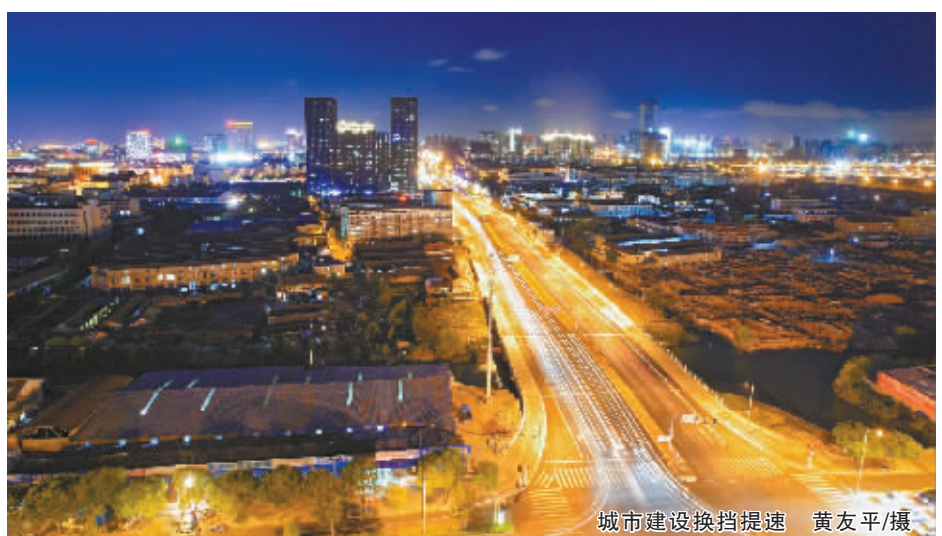
城市建设换挡提速

注重留出空间的规划引领，加快拆后土地的开发，对拆出来的土地做好分类处置。比如可以结合交通拥堵工作，多建一些停车场，没有项目的可以做公共绿地，做到宜耕则耕、宜绿则绿、宜建则建。同时，对项目一时难以落地的，可以先行绿化或者复垦，防止土地闲置，让老百姓早日感受到变化。