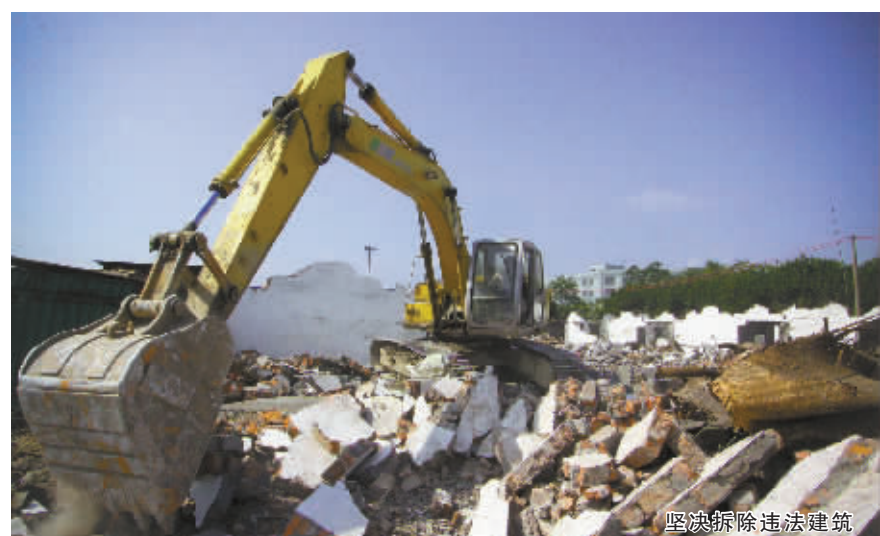
坚决拆除违法建筑

城市核心区拆违专项“清剿”整治事关城市品质的整体提升。按照重点突破、整体推进的要求，各县市区要把政府所在区域和中心镇、卫星城的核心地区作为今年拆违重点，全面细化违建甄别，建立健全违建清单，全力推进专项整治。在区域上，将先整治影响重点工程建设和城市品质提升的违法建筑；在类型上，先整治反映极大、影响极坏的“违建王”违法建筑，后整治自用型违法建筑；在时限上，要先整治在建、新建、突击建的，后整治历史遗留下来的违法建筑，切实拆出整体气势，拆出