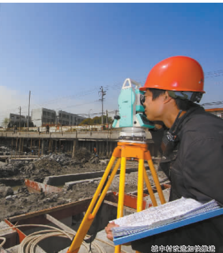
镇中街拆除加快进度

昨天召开的全市深化“三改一拆”暨“无违建”创建工作动员大会强调，各级各部门既要坚定信心，又要保持忧患意识，非常时期必须要有非常举措，要以超常规的决心、超常规的措施和超常规的力度将“三改一拆”工作抓紧抓好抓实。