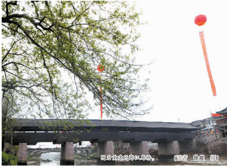
图为重建的印江廊桥。