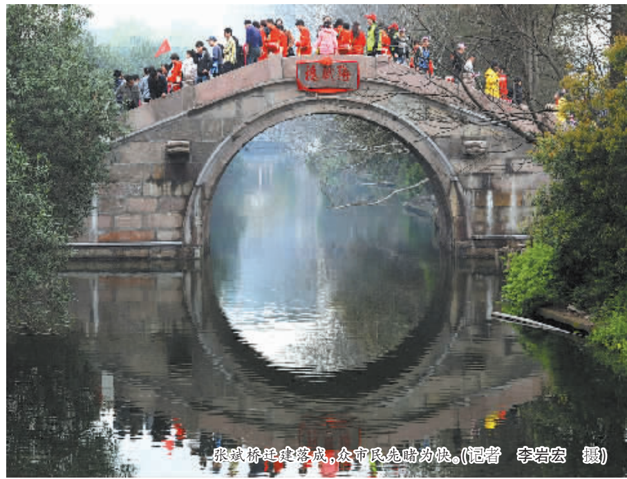
张斌桥重建落成，市民先睹为快。