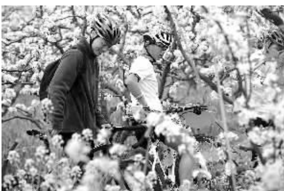
昨天上午,市民正在镇海区庄市街道光明村梨园内观赏梨花。当天,为期10天的“首届光明村梨花周”启动。