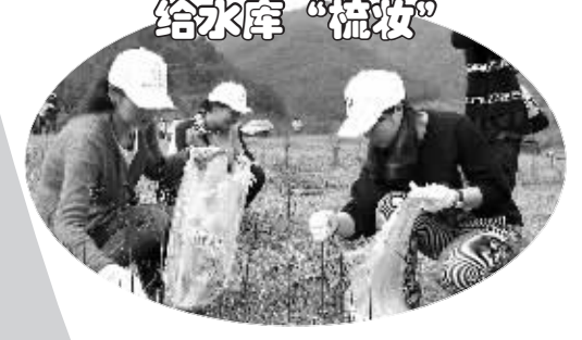
昨天上午,鄞州区近300名职工代表、各级工会志愿者走进东吴镇三溪浦水库,清理水畔的垃圾杂物,还库区一片洁净。