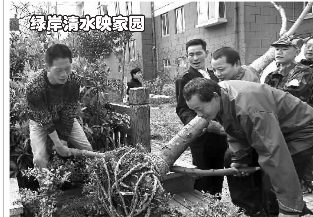
近日,海曙区段塘街道丽园社区开展邻里治水行动。来自街道的民兵分队、共建单位及居民志愿者130余人在庙前河河道进行绿地认领、垃圾清理、河道保洁等活动,并补种了100多棵乔木。

本报讯(孙吉晶)近日,浙江省农作物品种审定委员会第46次会议发布公告,我市选育的“甬优1512”等5个水稻品种通过审定。