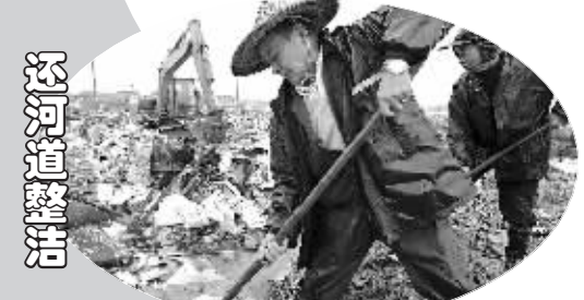
近日,施工人员进行冒雨清理鄞州古林镇薛家村跃进河道建筑垃圾。当天,该镇集中对河道周边多处废品堆场进行清理。