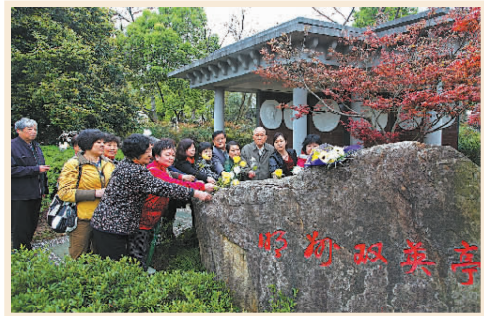
昨天上午,海曙区鼓楼街道中山社区组织党员代表、老战士、社工等到中山广场明州双英亭举行“清明情思祭先烈”主题教育活动,向在大革命时期牺牲的杨眉山等6位革命烈士献花,并重温入党誓词。

在选择理财投资品种时,金融消费者还应注意保持理性平和的投资心态,根据自己的风险承受能力水平选择最合适的投资品种。