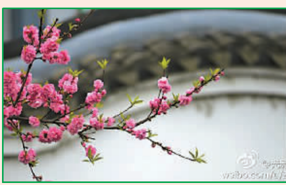
@光影漫步的空间: 桃花红。