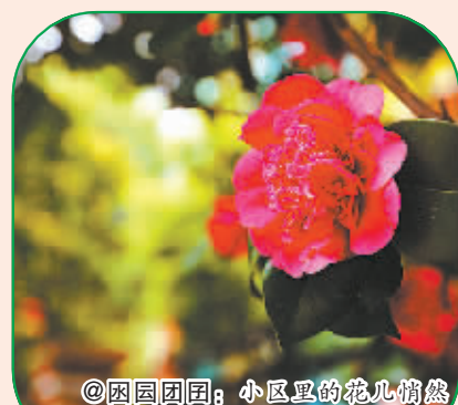
@因因团团: 小区里的花儿悄然萌出一抹鲜艳。