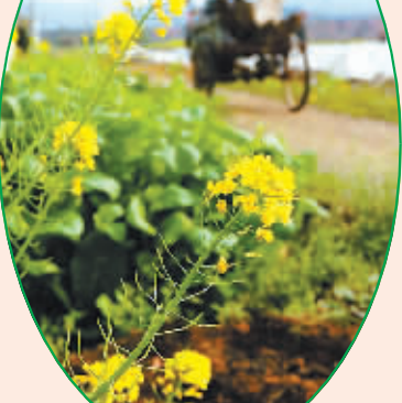
@沉莫无语: 油菜花盛开,金黄夺目。