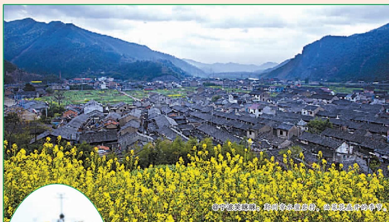
@宁波笑眯咪: 鄞州东钱湖畔,油菜花盛开的季节。