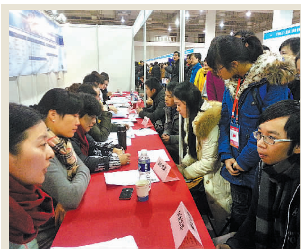
今年毕业生洽谈会上毕业生正在进行面试。