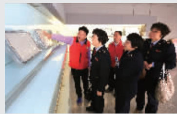
实地走访重点税源企业,为企业排忧解难