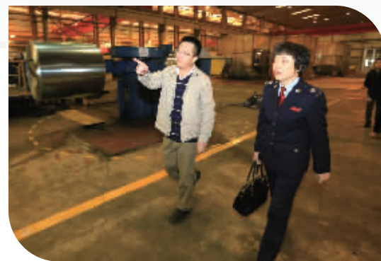
局领导带队深入企业开展“双带双走”走亲连心活动

在出口退税“破难提速”、“提质增效”专项行动取得阶段性成果的基础上,针对保税区外向型经济发展及出口退税工作的