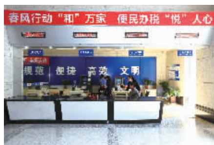
办税环境更加优化,自助服务规范便捷

从今年2月起,宁波保税区国税局拉开“便民办税春风行动”的序幕,在着力落实宁波市国税局推出的“办税服务再提速、首问责任深落实、纳税负担再减轻、纳税信用重应用、权力清单更透明”等五大行动措施的基础上,结合保税区实际,再增加“办税环境再优化、办税服务细回访、纳税服务零距离、请进国税话税收、同心协力促发展”等五项内容。通过一系列服务举措,进一步提升纳税人的满意度和税法遵从度,这也是宁波保税区国税局全面贯彻落实党的群众路线教育实践活动的具体举措。