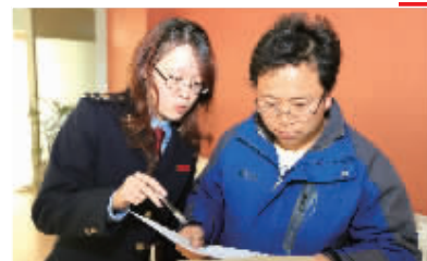
开展“和悦·零距离”送推服务

宁波保税区国税局门户网站: http://www.nbtax.gov.cn/bsqgsj/ 宁波保税区国税局官方微博: http://weibo.com/nbbsqgs 宁波保税区国税12366呼叫中心 电话: 0574-86712366 邮寄地址: 宁波市北仑区明州路771号803办公室, 邮编315800 电子邮箱: yangningbs@nbtax.gov.cn 截稿时间: 2014年4月30日