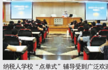
纳税人学校“点单式”辅导受到广泛欢迎