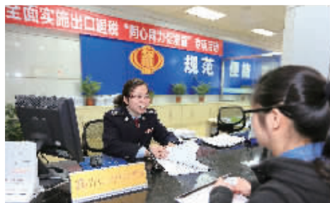
出口退税窗口工作人员热情接待纳税人咨询

开展“售后服务回访”工作。创新开启“三定制”纳税回访新模式。一是内容定制。根据不同纳税人的不同涉税需求“量体裁衣”,找准纳税人和纳税服务的结合点,有针对性地开展纳税辅导服务,进一步融洽征纳关系。二是时间定制。针对回访事项确定回访日期,制定回访计划表。回访结束后,征求纳税人对税务人员服务质量的意见和建议,及时填写回访记录。三是形