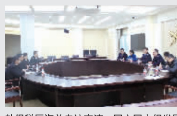
赴保税区海关走访交流,同心协力促发展