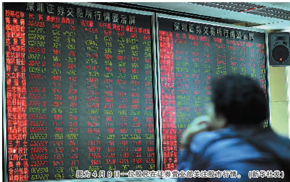
图为4月8日一位股民在证券营业部关注股市行情。

实际上, 沪港通对股市的利好效应已经在 10日的市场走势上有所体现。当日, 受沪港通试点获批提振, 沪市一改近期的低迷, 上证综指收于 2134.30 点, 涨幅为 1.38%。其中, 直接受益的券商保险板块出